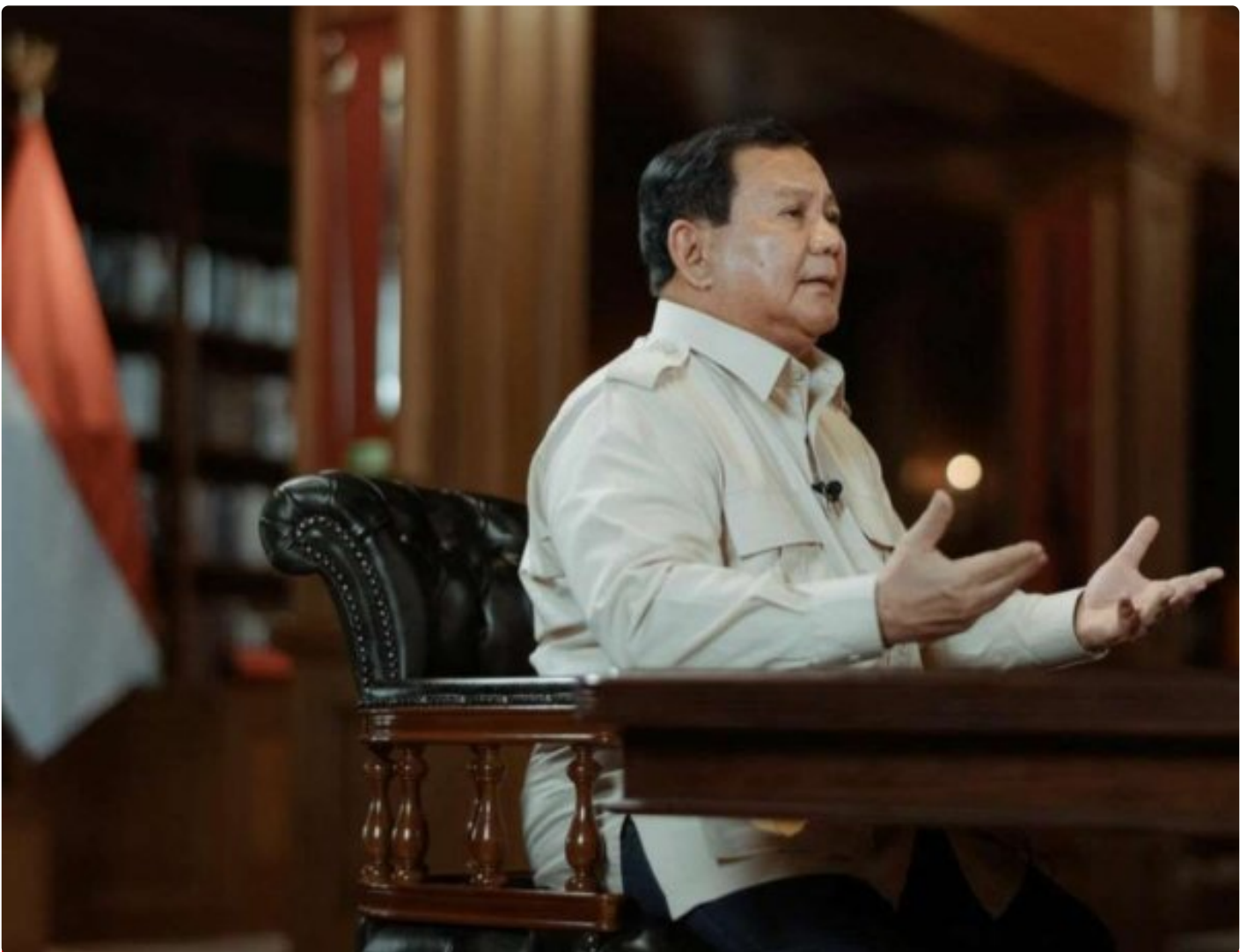
Prabowo Subianto Presiden RI 2024-2029

PENDIDIKAN - Indonesia dikenal sebagai negara yang kaya akan sumber daya alam . Dari hasil tambang yang berlimpah, laut yang luas dengan kekayaan hayati yang melimpah, hutan yang menjadi paru-paru dunia, hingga sumber daya energi yang tersebar di berbagai wilayah, semuanya menjadi kekuatan besar bagi